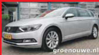
Volkswagen Passat Variant 2.0 Tdi 150pk DSG-automaat Business Edition / Adaptieve cruise / Navi / Stoel + stoelverwarming / 17 Inch / Incl 6 maand BOVAG garantie.