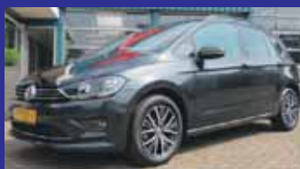
Volkswagen Golf Sportsvan 1.2 Tsi 110pk Highline All Star / 9.266km / Navigatie / Inparkeerhulp / Incl 6 maand BOVAG garantie.