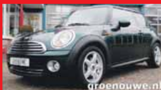
Mini 1.4 One Pepper Acc / Half leder / 16 Inch / Incl 6 maand BOVAG garantie.