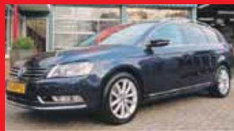
Volkswagen Passat Variant 1.6 Tdi High Executive Line / Leer / Xenon / Navi / Incl 6 maand BOVAG garantie.