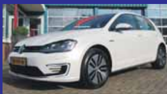
Volkswagen Golf 1.4 TSI GTE 204pk DSG-automaat / 7% / 34.531km / Navi / Pdc / Prijs excl btw / Incl 6 maand BOVAG garantie.