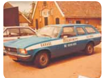
De eerste serviceauto!