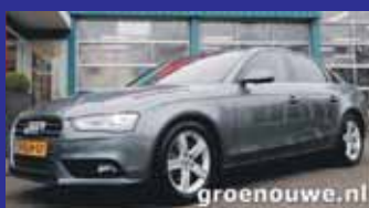
Audi A4 1.8 Tfsi 170pk Edition Xenon-led / Navi kleur / Sportstoelen etc / Incl 6 maand BOVAG garantie.