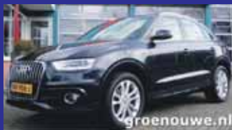
Audi Q3 1.4 Tfsi 150pk Proline S-Line Mmi navi kleur / 18 Inch / Incl 6 maand BOVAG garantie.