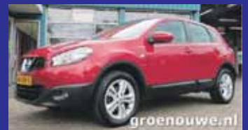
Nissan QASHQAI 1.6 Acenta Acc / Cruise control / 17 Inch / Incl 6 maand BOVAG garantie.