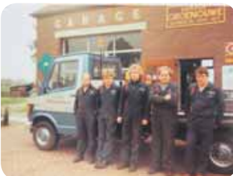
Het personeelsbestand groeide met de jaren.

De auto's waar hij die beginjaren aan sleutelde waren Kevers, de Opel Kadett of de Ford Taunus. "Auto's die veel minder complex waren dan de huidige auto's. Je had wel veel meer onderhoud. Om de 3500 kilometer kwamen mensen langs om de olie te verversen, nu is dat pas na 30.000 kilometer, en om de 10.000 kilometer was er de grote beurt. Er was ook nog geen APK-keuring en auto's waren in die jaren ook nog eens na 10 jaar compleet verroest!"