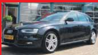
Audi A4 Avant 2.0 Tdi Ultra Sport S-Edition Xenon / 18 Inch / Incl 6 maand BOVAG garantie.