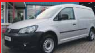
Volkswagen Caddy 1.6 Tdi 102pk MAXI Trekhaak / Achterklep / Incl 6 maand BOVAG garantie.