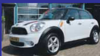
MINI Countryman 1.6 Business Line Navigatie kleur / Cruise control / Zwart dak + strepen etc / Incl 6 maand BOVAG garantie.