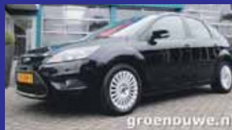
Ford Focus 1.8 Limited 5-deurs / Navigatie / Pdc / Acc / Voorruit verwarming / Multi stuur etc.