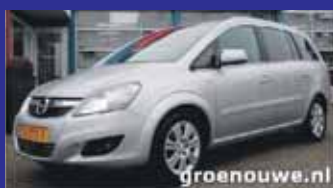
Opel Zafira 1.6 16v COSMO 7-Pers Xenon / Stoelverwarming / Incl 6 maand BOVAG garantie.