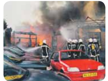
De grote brand in 1997.