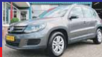
Volkswagen Tiguan 1.4 Tsi Comfortline Open dak / Navigatie / Pdc V + A incl inparkeerhulp / Incl 6 maand BOVAG garantie.