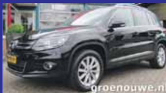
Volkswagen Tiguan 1.4 Tsi 160pk Comfort & Design / Navigatie kleur / Wegklapbare trekhaak etc veel opties / Incl 6 maand BOVAG garantie.