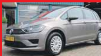
Volkswagen Golf Sportsvan 1.2 Tsi 110pk Comfortline / Xenon / Pdc V + A / Stoelverwarming / Incl 6 maand BOVAG garantie.