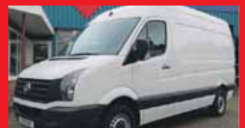
Volkswagen Crafter 35 2.0 Tdi 136pk L2H2 Pdc voor + achter / Climatic Airco / Bijrijdersbank etc.