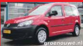
Volkswagen Caddy Life 1.2 Tsi Airco / Achterklep / Incl 6 maand BOVAG garantie.