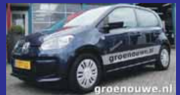
Volkswagen up! 1.0 MOVE UP! BLUEMOTION 5 deurs / Navigatie / Airco / Incl 6 maand BOVAG garantie.