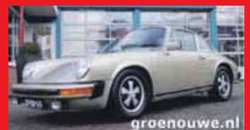
Porsche 911 S 2.7 Coupe Small body / Matching numbers / Fuchs / Sunroof / Certificate of Authenticity.