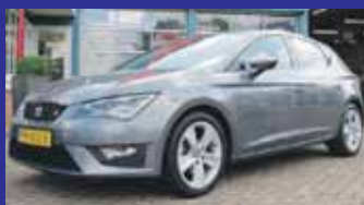
Seat Leon 1.4 Tsi 140pk FR Led / Navi kleur / 17 Inch / Leder-alcantara etc veel opties / Incl 6 maand BOVAG garantie.