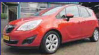
Opel Meriva 1.4 Turbo Business+ Navigatie kleur incl camera / Pdc V+A / Incl 6 maand BOVAG garantie.