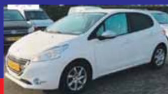
Peugeot 208 1.2 VTI Allure Navi kleur / Pdc / 15 Inch / Incl 6 maand BOVAG garantie.