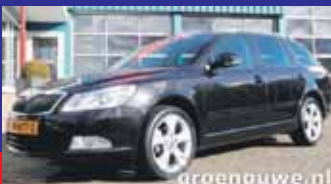
Skoda Octavia Combi 1.2 Tsi DSG 140pk ABT - automaat Elegance / Xenon / Navi groot / Pdc V + A / Incl 6 maand BOVAG garantie.