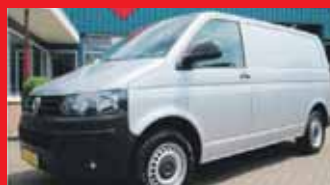
Volkswagen Transporter 2.0 TDI L1H1 Navigatie kleur / Multi stuur / Cruise control etc.