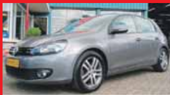
Volkswagen Golf 1.2 Tsi 105pk Comfortline Sportstoelen / Acc / 16 Inch etc / Incl 6 maand BOVAG garantie.