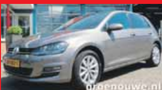
Volkswagen Golf 1.4 Tsi Highline / 26.232km / Xenon / Pdc voor + achter / Incl 6 maand BOVAG garantie.