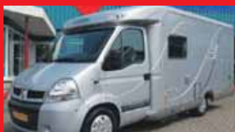
Hymer Tramp 514 GT 3.0 Dci Dwarsbed / Ruime garage / Incl 6 maand BOVAG garantie.