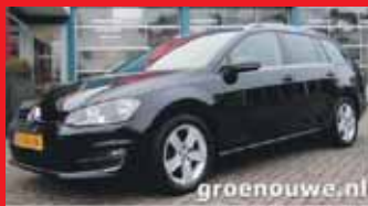
Volkswagen Golf Variant 1.4 Tsi Highline Open dak / Groot navi / Stoelverwarming / Handsfree / Incl 6 maand BOVAG garantie.