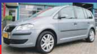
Volkswagen Touran 1.4 Tsi 140pk Optive Navigatie / 17 Inch / Trekhaak / Incl 6 maand BOVAG garantie.