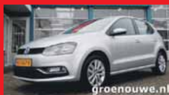
Volkswagen Polo 1.2 Tsi DSG-automaat Comfortline / Cruise control / Sportvelgen / Incl 6 maand BOVAG garantie.