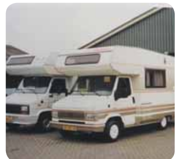
Groenouwe begon in 1993 met het verhuren van campers.