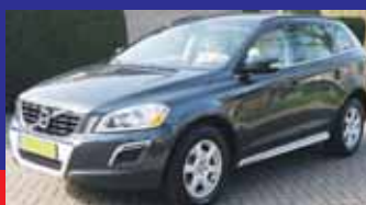
Volvo XC60 2.4 D3 AWD Summum Automaat / Xenon / Leer / Incl 6 maand BOVAG garantie.