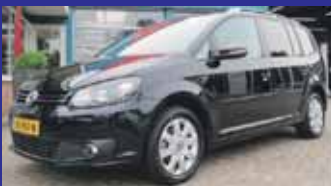
Volkswagen Touran 1.2 Tsi Highline Cup 7P. Xenon-Led / Inparkeerhulp / Incl 6 maand BOVAG garantie.