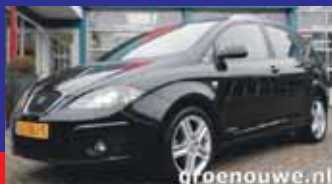
Seat Altea 1.2 Tsi 105pk COPA Xenon / Navigatie kleur / 17 Inch / Incl 6 maand BOVAG garantie.