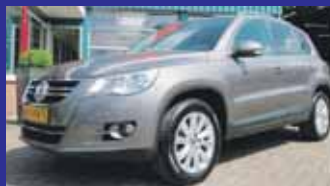
Volkswagen Tiguan 1.4 Tsi 150pk Sport & Style Acc / Trekhaak / Incl 6 maand BOVAG garantie.