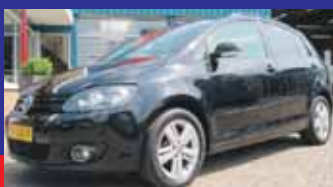
Volkswagen Golf Plus 1.2 Tsi Highline Match Stoelverwarming / Pdc V+A / 16 Inch / Incl 6 maand BOVAG garantie.