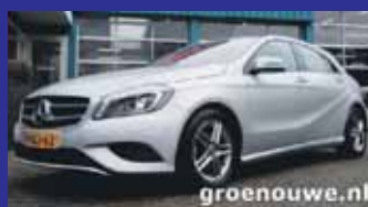
Mercedes-Benz A-Klasse 180 EDITION Xenon / Navigatie / Pdc V + A / Incl 6 maand BOVAG garantie.