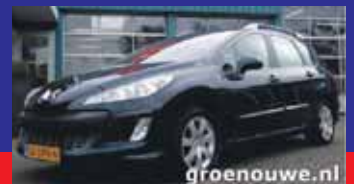
Peugeot 308 SW 1.6 150pk THP Sport Plus Acc / Incl 6 maand BOVAG garantie.