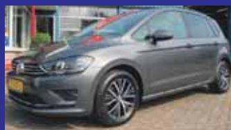
Volkswagen Golf Sportsvan 1.2 Tsi 110pk Highline All Star / 12.492km / Navigatie / Inparkeerhulp / Incl 6 maand BOVAG garantie.