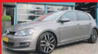
Volkswagen Golf 1.6 Tdi DSG-automaat Comfortline / Leer / Navigatie / 18 Inch / Incl 6 maand BOVAG garantie.